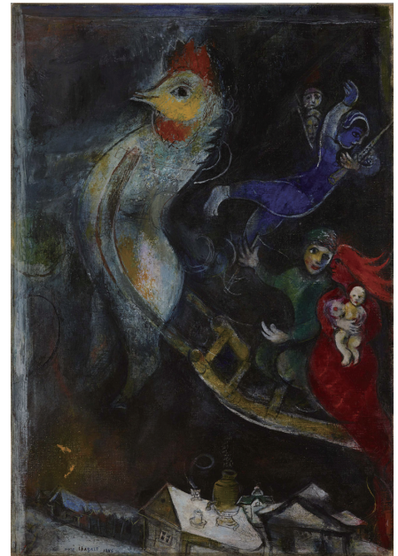
© ADAGP, Paris & JASPAR, Tokyo, 2016, Chaga11*G0709 シャガール「空飛ぶアトラージュ」1945年 福岡市美術館