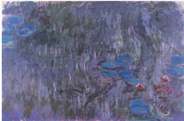
モネ「睡蓮 柳の反影」1916-19年 北九州市立美術館

北九州市立美術館のモネ、ルノワール、ドガ、ヴラマンク、岸田劉生、坂本繁二郎、海老原喜之助、草間彌生、福岡市美術館のシャガール、ミロ、ダリ、ウォーホル、レオナルド・フジタ(藤田嗣治)、黒田清輝、佐伯祐三など、両館の誇る名品群で構成されます。双方の美術館のリニューアル工事を機に、ふたつの美術館の珠玉のコレクションがめぐりあい、響きあい、「夢の美術館」が出現します。