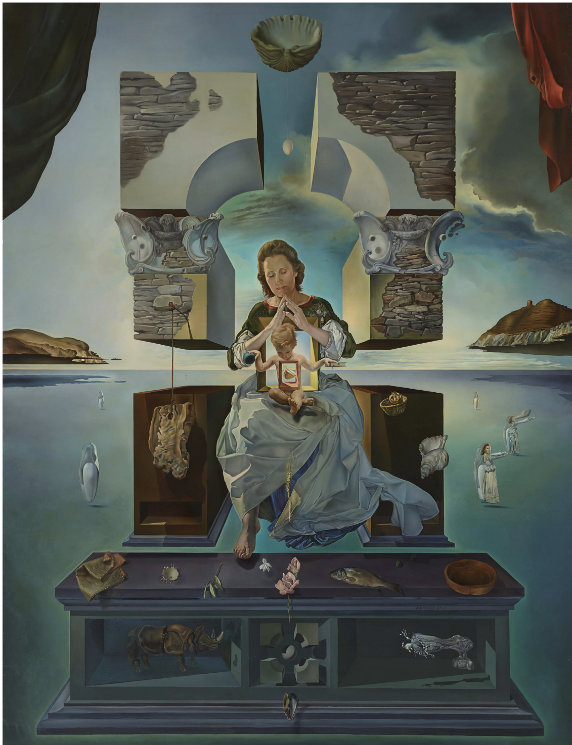
ダリ《ポルト・リガトの聖母》1950年 福岡市美術館 © Salvador Dalí, Fundació Gala-Salvador Dalí, JASPAR Tokyo, 2016 G0709

モネ、ルノワール、ドガ、シャガール、ダリ、 レオナルド・ダ・ヴィンチ、草間彌生など世界の巨匠をはじめ、 日本を代表する画家たちの名品が熊本に集結。