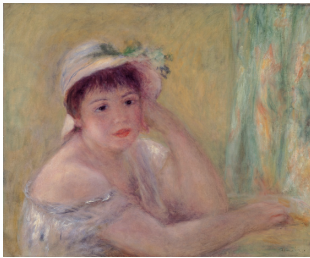
ルノワール「麦わら帽子を被った女」 1880年 北九州市立美術館