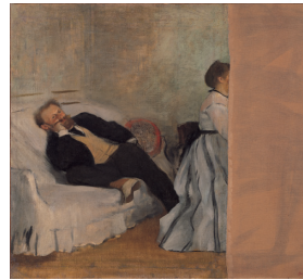
ドガ「マネとマネ夫人像」 1868-69年頃 北九州市立美術館