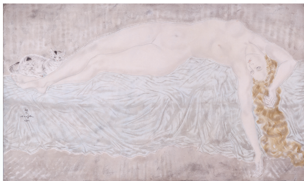
© Fondation Foujita/ADAGP, Paris & JASPAR, Tokyo, 2016G0709 レオナルド・フジタ「仰臥裸婦」1931年 福岡市美術館